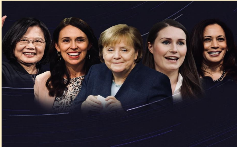
ผู้หญิงที่มีบทบาททางด้านการเมือง

สตรีนิยม คือ ความเชื่อที่ว่าผู้หญิงมีสิทธิเท่าเทียมในด้าน การเมือง เศรษฐกิจ และสังคม สตรีนิยมมุ่งมั่นที่จะทำให้ผู้หญิง สามารถใช้สิทธิของตนได้อย่างสมบูรณ์เท่าเทียมกับผู้ชาย